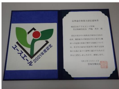
基準適合事業主認定通知書

若者の採用・育成に積極的で、若者の雇用管理の状況などが優良な中小企業を厚生労働大臣が認定する制度です。これらの企業の情報発信を後押しすることなどにより、企業が求める人材の円滑な採用を支援し、若者とのマッチング向上を図っています。